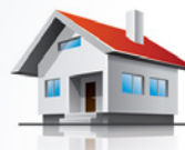
Vergleich der Betriebskosten

*Schallleistungspegel für STRATON® S17 (Teillast/Volllast).